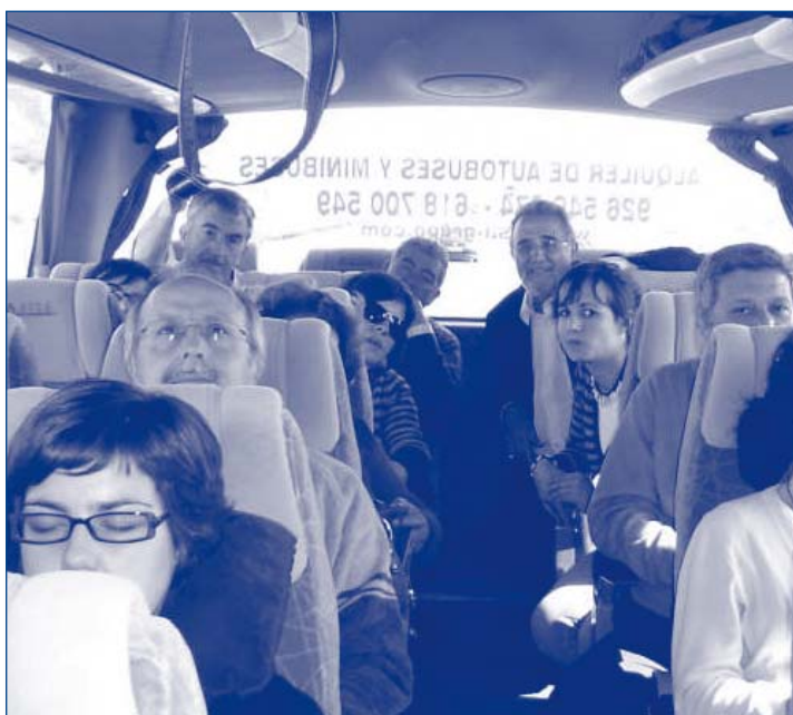
Viaje de regreso con los compañeros extremeños

Se informa sobre las modalidades de formación (Cursos y Seminarios) que cada asociación puede solicitar, y se les entrega la información pertinente para que puedan realizar sus gestiones.. Como COPOE, este trámite resulta más complicado. Se va a estudiar la posibilidad de presentar un curso o seminario a finales de año que suponga una financiación por parte del MEC para que la asistencia no nos sea tan gravosa.